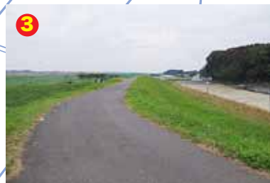
土手上から布施弁天方向を望む