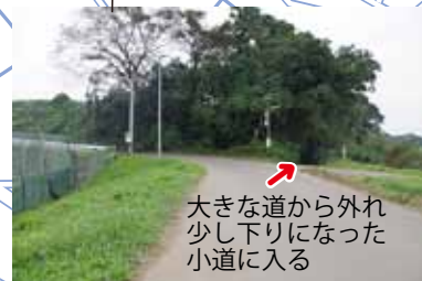
大きな道から外れ少し下りになった小道に入る