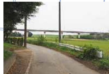
細い脇道の進行方向