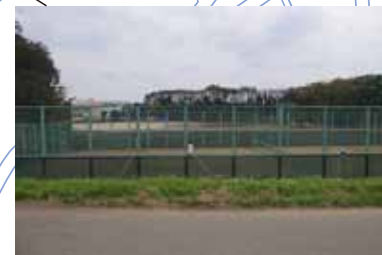
テニスコート、グラウンド