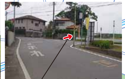
大きい道を越え細い脇道に入る(上写真)