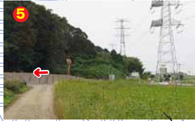
二つ目の鉄塔前を左に