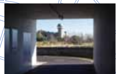
橋を渡りココス前の横断歩道を渡って引き返す形で手賀沼の手前で橋をくぐる。